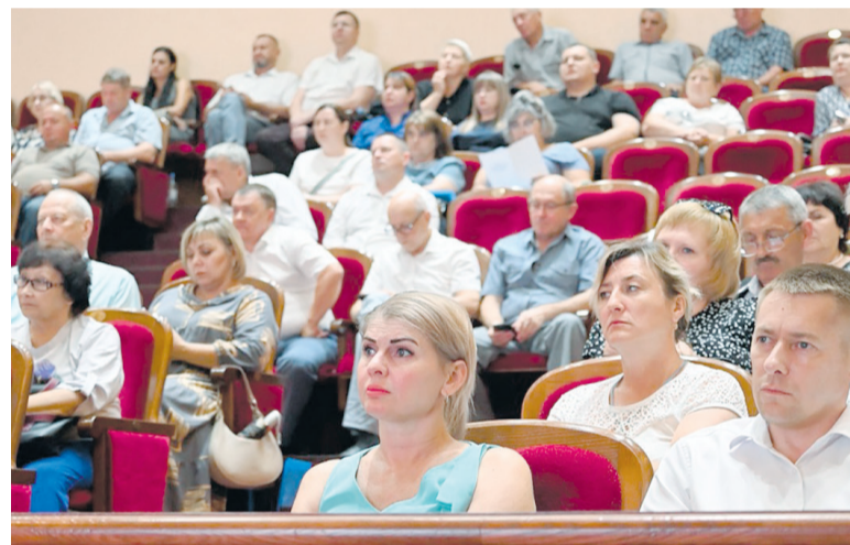
Зональное совещание в г. Бугуруслане

В итоговом документе будет прописано увеличение доходов населения, продолжительности жизни, развитие систем образования и здравоохранения, транспортной инфраструктуры. Стратегия – это комплексный документ, своеобразный план для достижения больших целей. И важно понимать и учитывать запросы территорий.