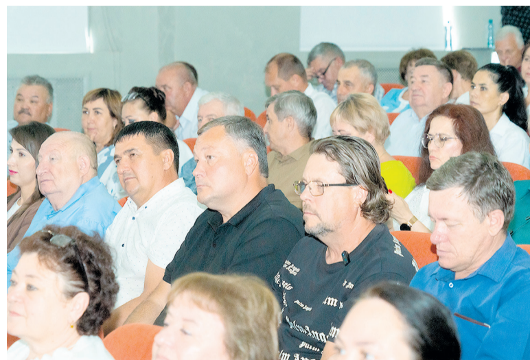
Зональное совещание в с. Сакмара

В 2025 году на участие в проекте подано 386 заявок, 220 признаны победителями и отобраны для последующей реализации. Останавливаться на достигнутом область не собирается.